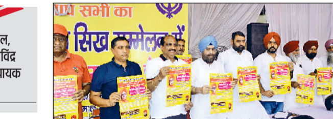
करनाल। सम्मेलन का पोस्टर जारी करते आयोजक।