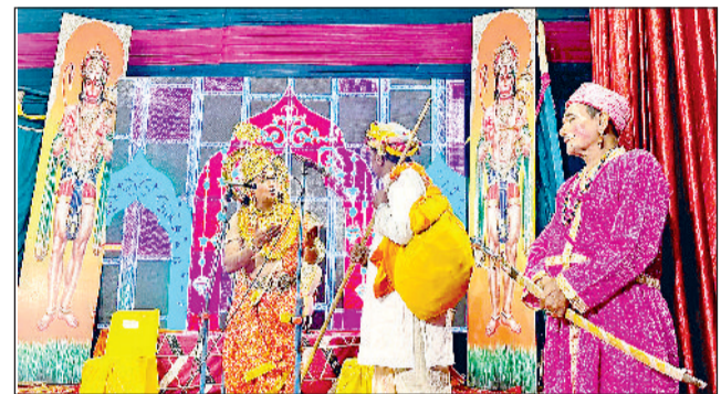
घरोड़ा। रामलीला का मंचन करते कलाकार।