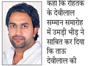
कहा कि रोहताक के देवीलाल सम्मान समारोह में उमड़ी भीड़ ने साबित कर दिया कि ताऊ देवीलाल की विचारधारा आज