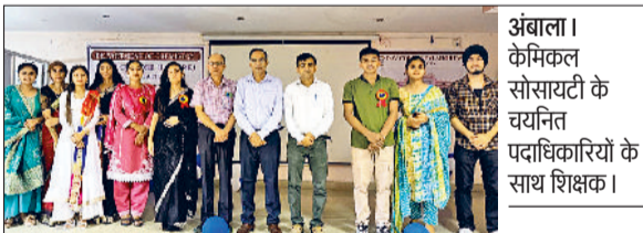
अंबाला। केमिकल सोसायटी के चयनित पदाधिकारियों के साथ शिक्षक।