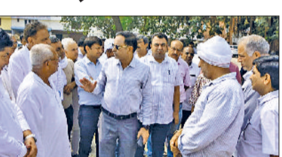
पानीपत। उपायुक्त वीरेंद्र दहिया, मंडी में धान की खरीद का जायजा लेते हुए।

पानीपत। हरियाणा में धान की खरीद शुरू हो चुकी है, मंडियों में किसानों को धान बेचने में कोई दिक्कत न आए, इसके लिए सरकार द्वारा विशेष प्रबंध किए गए हैं, जिले की मंडियों में खरीद प्रबंधों का जायजा लेने के लिए उपायुक्त वीरेंद्र दहिया ने शनिवार को जिले की बाबरपुर व पानीपत मंडी का दौरा किया। उन्होंने संबंधित अधिकारियों को निर्देश दिए कि धान खरीद के दौरान किसानों को दिक्कत नहीं आने चाहिए, किसानों को फसल का उचित दाम मिले और फसल का समय पर उठान हो। उन्होंने सख्त निर्देश दिए कि यदि धान खरीद के दौरान किसी भी खिल्लाफ कार्यवाही की जाएगी। दूसरी ओर, डीएम्डीओ महाबीर सिंह ने बताया कि जिले की सभी मंडियों में धान खरीद के व्यापक प्रबंध किए गए हैं, मंडियों में धान की आवक शुरू हो गई है।