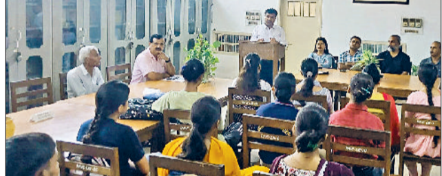
अंबाला। व्याख्यान में मौजूद छात्र व शिक्षक।