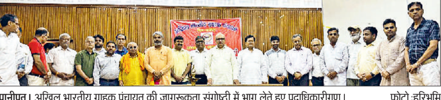
पानीपत। अखिल भारतीय ग्राहक पंचायत की जागरूकता संगोष्ठी में भाग लेते हुए पदाधिकारीगण।

एसडी पीजी कॉलेज में अखिल भारतीय ग्राहक पंचायत की पानीपत इकाई द्वारा ग्राहक जागरूकता संगोष्ठी का आयोजन किया गया। जिसका मुख्य उद्देश्य ग्राहकों को उनके अधिकारों और हितों के प्रति जागरूक करना रहा ताकि वे अपने अधिकारों को पहचान और समझ