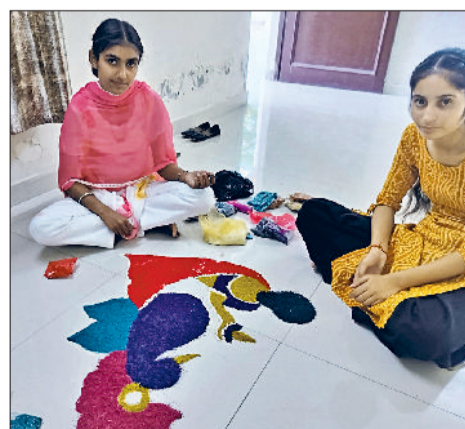
अंबाला। कार्यक्रम के दौरान बनाई रंगोली का प्रदर्शन करती छात्राएं।