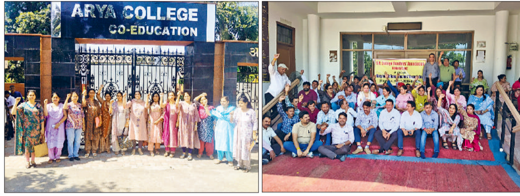
अंबाला। मांगों को लेकर आर्य कॉलेज व एसएसए जैन कॉलेज में प्रदर्शन करते कॉलेज टीचर्स।

ज्ञापन में सभी कर्मचारियों के हस्ताक्षर करवाकर मुख्यमंत्री नायाब सिंह सैनी व शिक्षा विभाग के एसोएस को भेजा गया है, शिक्षकों को समय पर नहीं मिल रहा वेतन