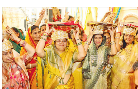
पानीपत। श्री दिगंबर जैन मंदिर बड़ा मंदिर जैन मोहल्ला में पूजन करते हुए श्रद्धालु।